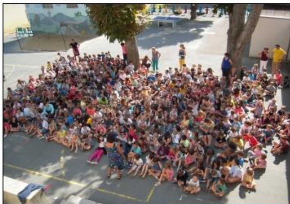
Rassemblement d'élèves le jour de la rentrée.

Elèves de Ce1 : J'aime bien quand le mercredi y a pas d'école parce que je fais du sport le matin. Moi je vais chez ma mamie. Moi je préférerais venir à l'école. On va souvent voir ma sœur à l'équitation le mercredi.