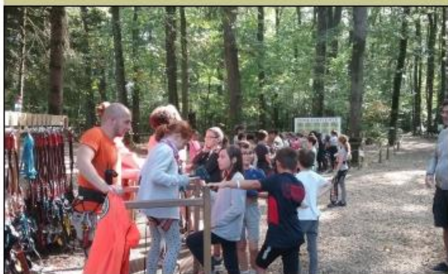
Les élèves s'équipent.