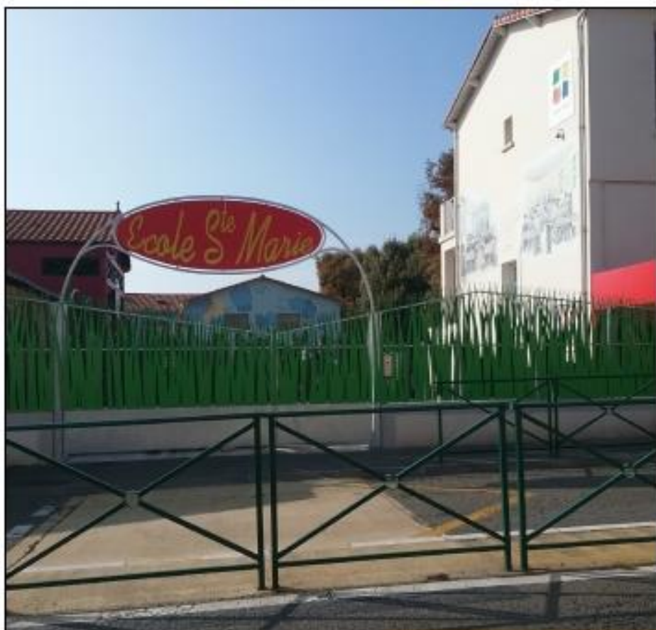
nouveau portail de l'école

Sylvie : J'essaie d'introduire de plus en plus de langues étrangères, je donne des consignes en anglais et en langue des signes. J'ai aussi fait la matinée jeux avec les personnes âgées hier et j'ai trouvé que c'était intéressant. Les élèves ont trouvé ça amusant de faire des jeux.