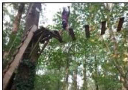
Les élèves s'élancent dans les arbres.